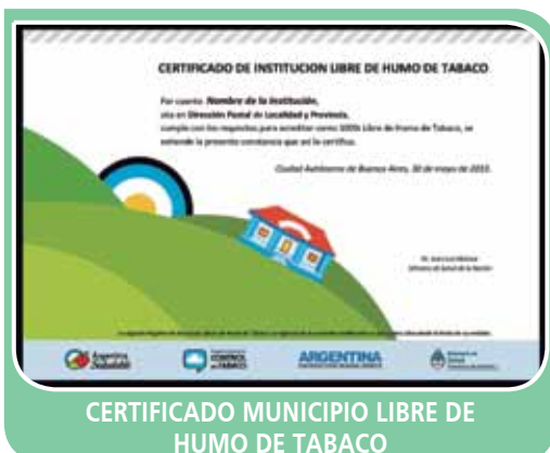
CERTIFICADO MUNICIPIO LIBRE DE HUMO DE TABACO