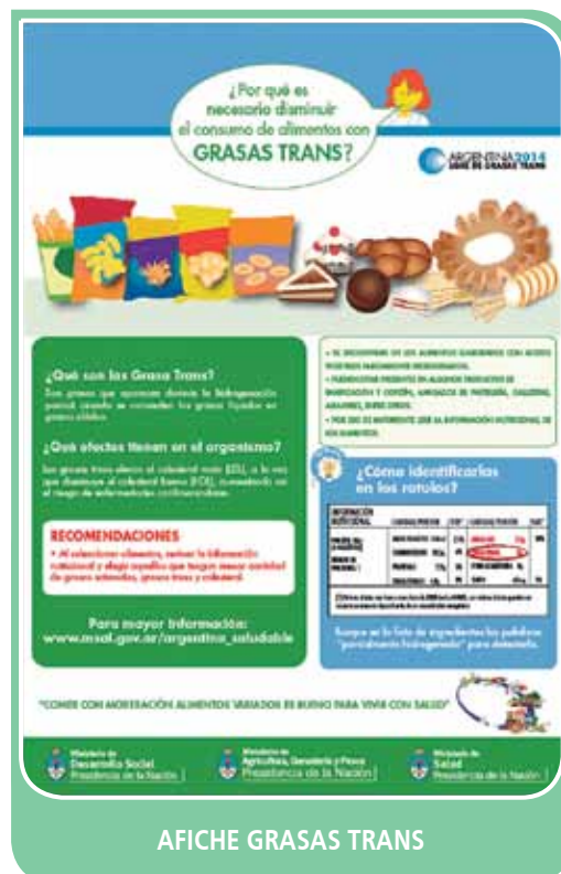
AFICHE GRASAS TRANS

Con la inminente finalización de dichos plazos de adecuación a estas exigencias, se requiere el fortalecimiento del sistema de control de alimentos en las áreas de vigilancia, auditoría y laboratorio a través de asesoramiento, capacitación y equipamiento para la concreción de un plan federal y de carácter sostenible en el tiempo.