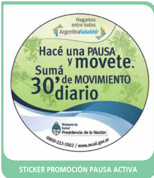
STICKER PROMOCIÓN PAUSA ACTIVA

honorables consejos deliberantes tienen al momento de dictar ordenanzas municipales que por ejemplo generen espacios 100% libres de humo o regulen la oferta de la sal. Muchos municipios han avanzado en esta dirección, inclusive con anterioridad a leyes nacionales. A continuación se abordarán por ejes temáticos algunos aspectos de las ECNT que podrían ser regulados y por ende repercutir positivamente en la salud de la población.